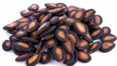
Huile de graines de pastèque de Kalahari

Conseil : Une utilisation correcte et une application conforme des produits parfaitement combinés au Color System de La Biosthétique garantissent un résultat optimal.