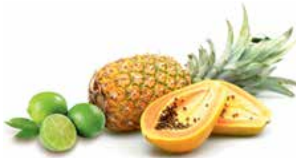
Acides de fruits