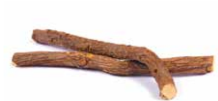
Extrait de racine de réglisse

Appliquer en couche fine Skin Protecting Oil le long des contours. Procéder ensuite comme d'habitude. Scalp Protecting Cream est idéale pour protéger le cuir chevelu lors des processus de coloration chimiques.