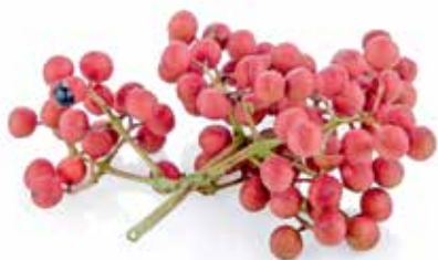
Extrait de bois jaune