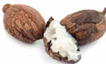
Beurre de karité