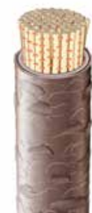
Structure capillaire en capacité d'absorber les pigments de couleur