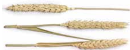
Protéines de blé

Vaporiser uniformément avant la coloration sur cheveux secs, sans rincer. Sécher les cheveux en cas de besoin.