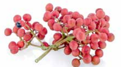
Extrait de bois jaune