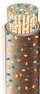
Cheveu après le traitement avec Post Colour Rinse