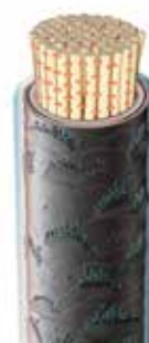
Cheveux présentant des résidus

Conseil : Lorsqu'une coloration est prévue après le nettoyage avec Deep Purifying Shampoo , nous recommandons d'équilibrer la structure capillaire avec Structure Balancing Spray avant l'application de la couleur.