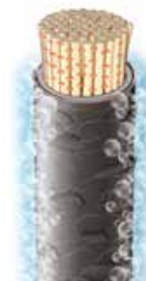
Action nettoyante profonde de Deep Purifying Shampoo